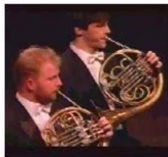
เฟรนช์ฮอร์นดูโอ

การผสมวงที่ใช้เครื่องสายไวโอลิน 2 คัน รวมเรียกว่า " สตริงดูโอ" (String Duo) ในงานของ ลุยส์ ชโปร์ ( ค. ศ. 1784-1859) คีตกวีและนักไวโอลินชาวเยอรมัน และของบาร์ท็อค