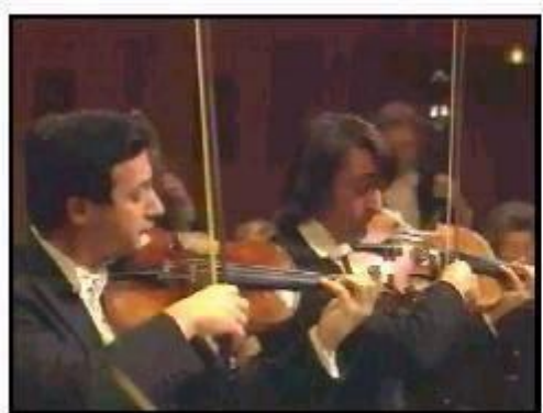
สตริงดูโอ